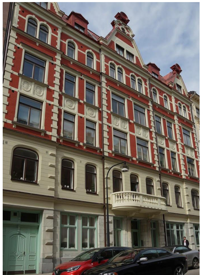
Fasadrenoveringsprojekt på Grev Magnigatan 15 på Östermalm utfördes av Puts & Plattsättnings AB.