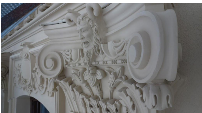
Stuckatur Grand Hôtel.

Det är Puts & Plattsättnings AB, Stockholm, som haft fasadrenoveringen.