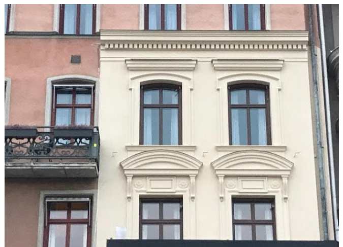
Ny fasadkulör provas på Grand Hôtel.